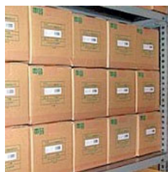
物流用管理ラベル