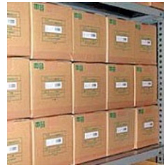
物流用管理ラベル